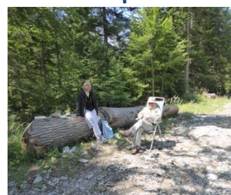
l' Amadouvier .

Les prairies du Col de La-Croix-Haute nous offrirent une surabondance de plantes et de fleurs qu'il nous fallut reconnaître pour les apprivoiser...Quel beau bouquet final à ce voyage !